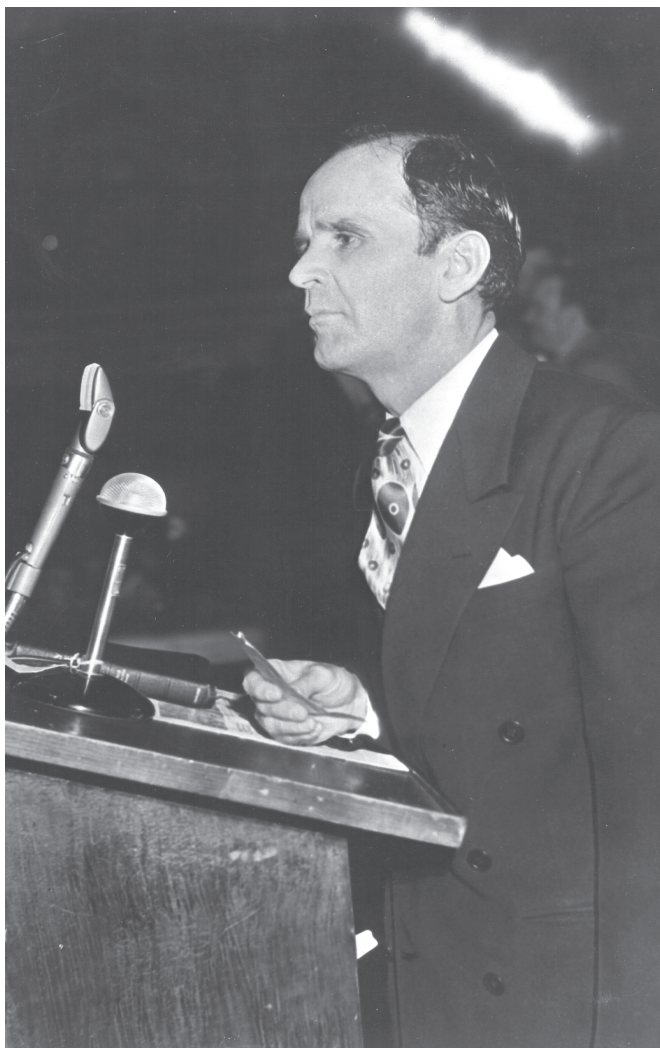
William Marrion Branham